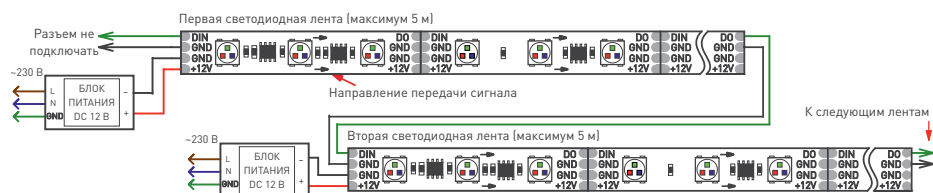
Рис. 1. Схема подключения ленты без использования внешнего контроллера (максимум 1024 пикселя, общий рисунок динамического эффекта при переходе с ленты на ленту сохраняется)