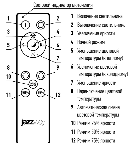
Пульт дистанционного управления (ДУ)